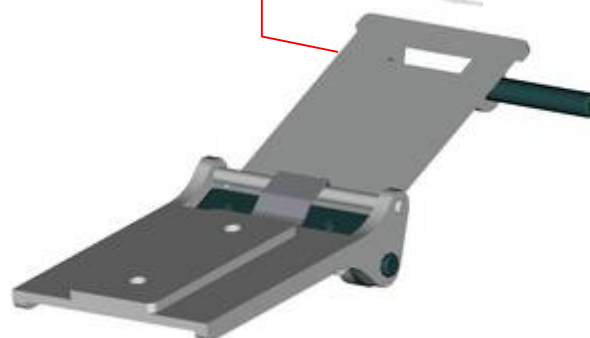
Bolzen, einseitig bereits eingesetzt.